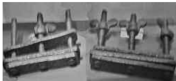
Daumenschrauben, Scharfrichter im Vest

Dies brachte auch Sehnsüchte zum freiwilligen Opfertod mit sich und drückte sich besonders bei unteren Klassen im Begehrt zur Hexenprobe aus. Ging man in's Wasser (Wasserprobe) und ertrank dabei, konnte man nicht mehr gefoltert und gezwungen werden, nahe Angehörige der Zauberein und Hexerei zu bezichtigen.