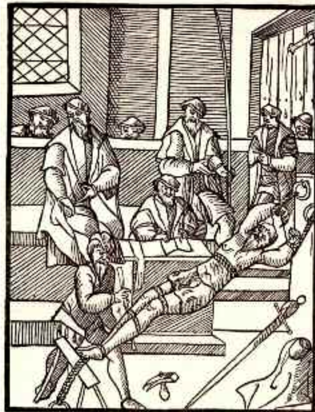
Folterung durch Strecken (Holzschnitt 1554)