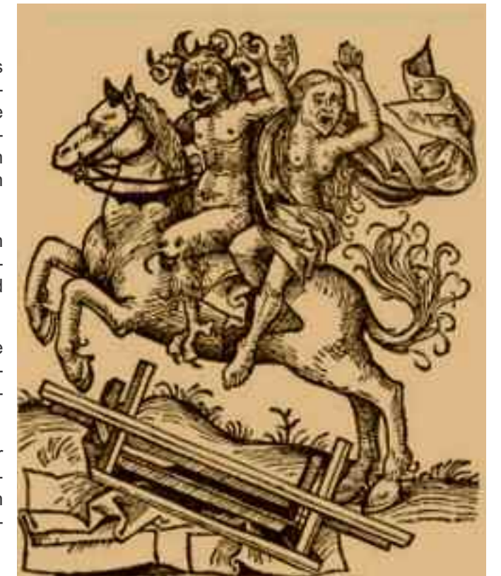
Teufel entführt eine "boshafte Zauberin", um mit ihr als Hexe zu buhlen und einen Bund zu schließen. Holzschnitt, Schedelsche Weltchronik, Nürnberg, 1493

Da beten allein nicht half, wurden als Schadensverursacher an Besitz, Leib und Leben von den christlichen Fundamentalisten die Hexen benannt. Damit wurde durch Predigten von der Kanzel herab der Wahn der Schadenzauberei und die Hexenjagd auf den Weg gebracht.